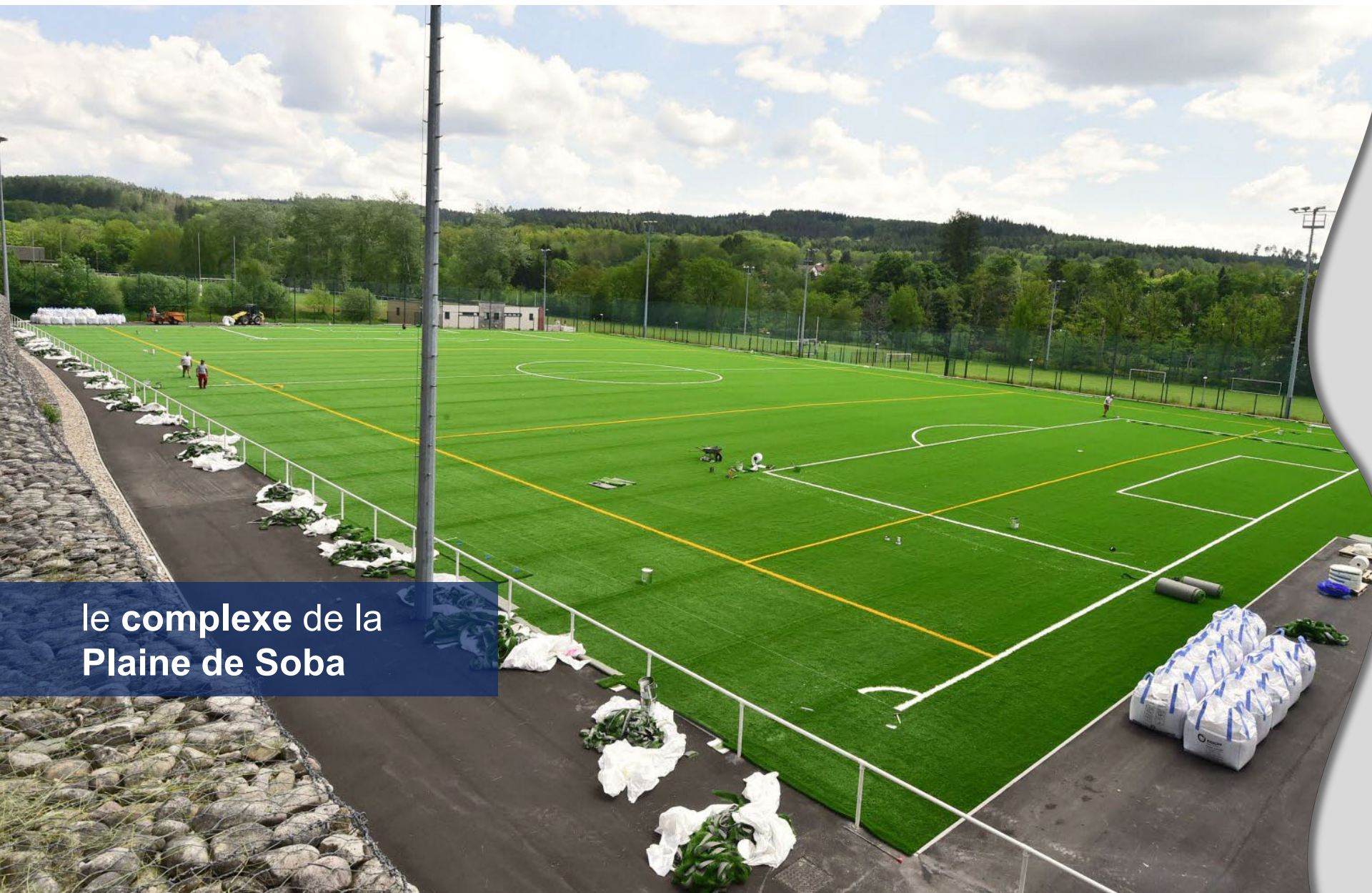
le complexe de la Plaine de Soba