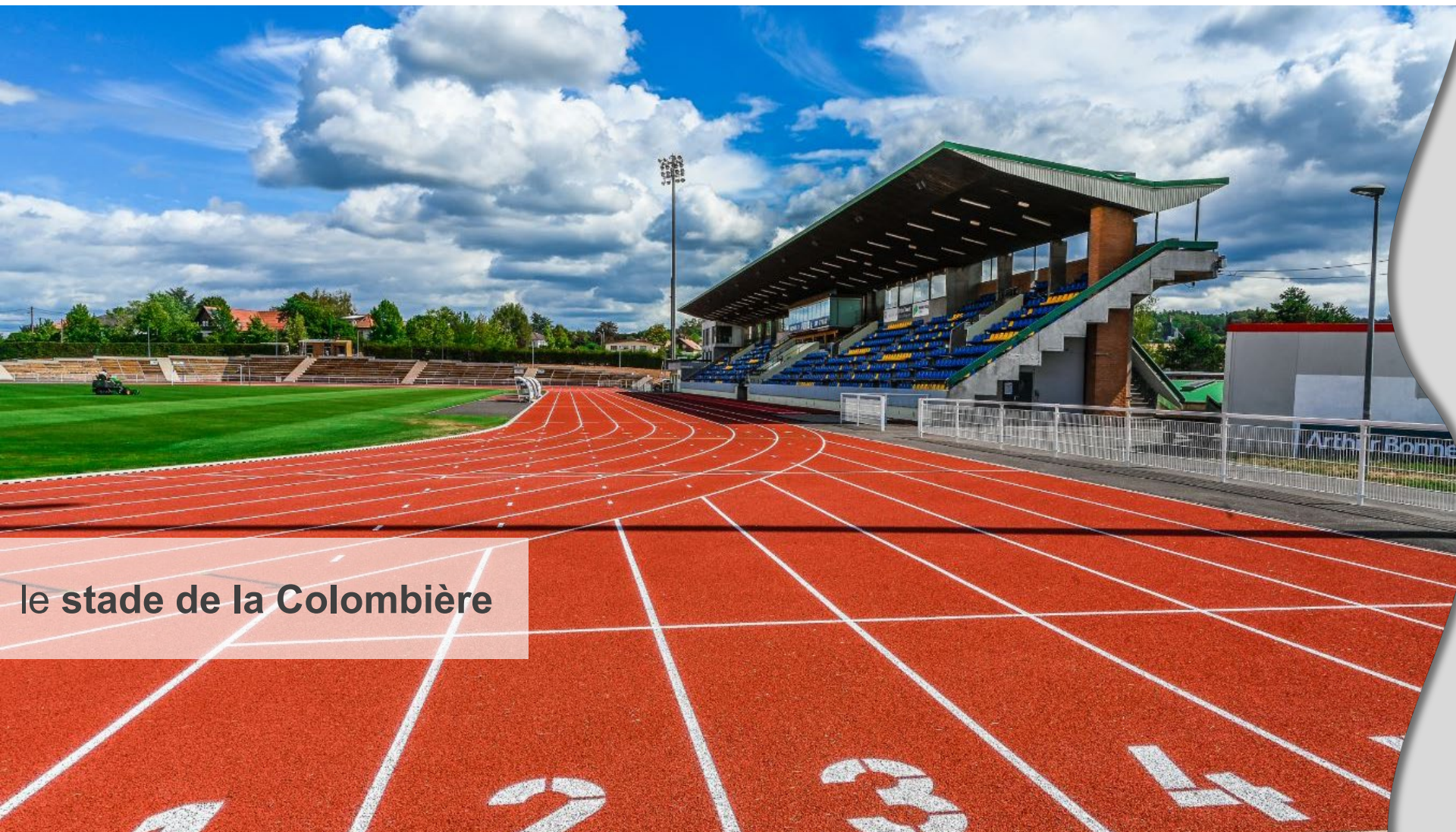
le stade de la Colombière